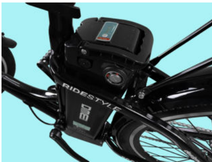
Batteria al litio 36V 10Ah

FRIENDLY è la nuova bicicletta elettrica da passeggio. Il suo design classico ricorda quello tipico olandese ma, gli accessori, le caratteristiche e le nuove decalcomanie la rendono invece, una bici moderna ed elegante. Questa bicicletta elettrica renderà le vostre passeggiate in città dei piacevolissimi momenti della vostra giornata.