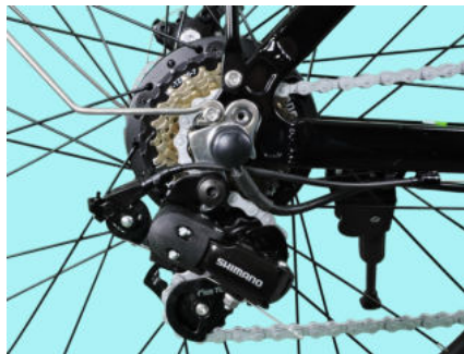
Cambio SHIMANO Tourney