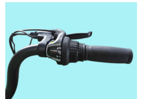
Comando SHIMANO Revoshift